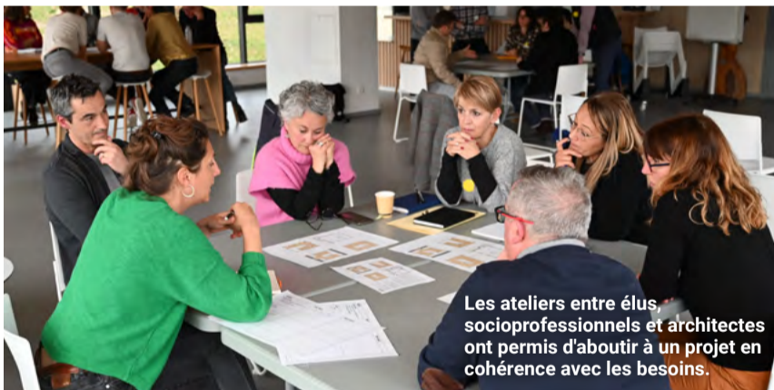
Les ateliers entre élus, socioprofessionnels et architectes ont permis d'aboutir à un projet en cohérence avec les besoins.

Le dépôt de permis de construire de la Maison des saisonniers donne le réel coup d'envoi à sa réhabilitation.