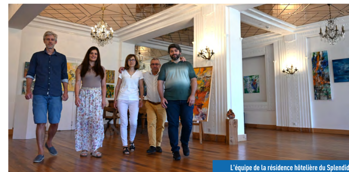
L'équipe de la résidence hôtelière du Splendid.