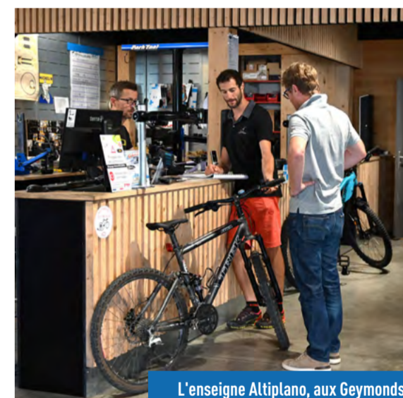
L'enseigne Altiplano, aux Geymonds