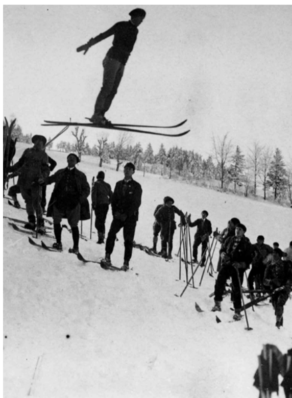
Saut à ski au tremplin des Cochettes

L'histoire commence en 1909, avec la création officielle d'une association autour de deux disciplines maîtresses : le ski alpin, qui vient d'être introduit en France, et le bobsleigh. La section