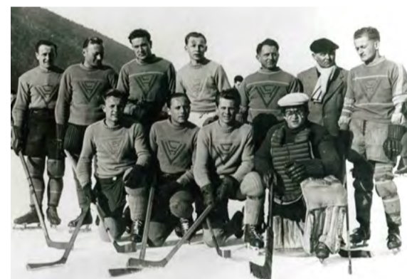
L'équipe des Ours en 1947