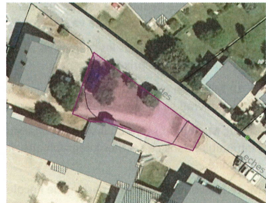
Emprise du projet sur le domaine public routier

Afin de finaliser la transaction immobilière, il est aujourd'hui nécessaire d'acter de la désaffectation matérielle de ces espaces et de procéder à leur déclassement du domaine public afin de les intégrer dans une nouvelle parcelle du domaine privé communal.